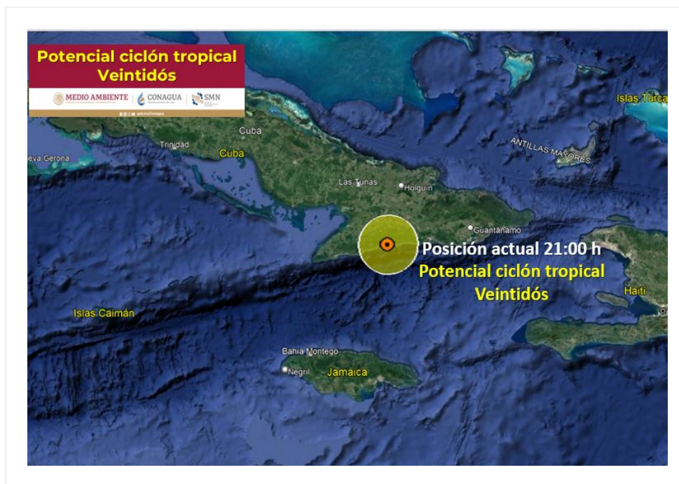
Imagen de trayectoria del potencial ciclón tropical Veintidós